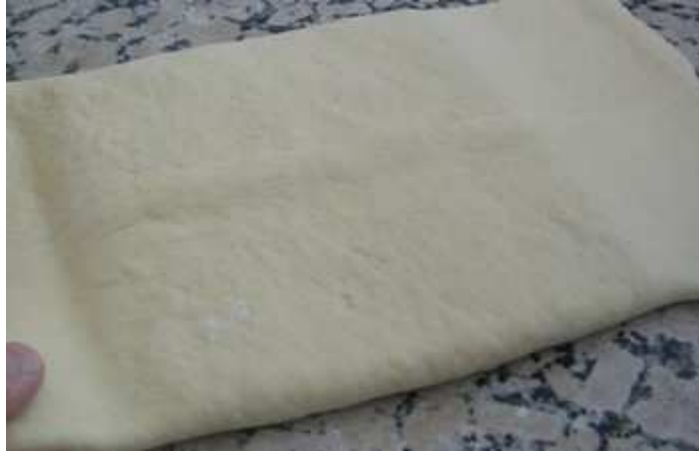
Enfermer la détrempe