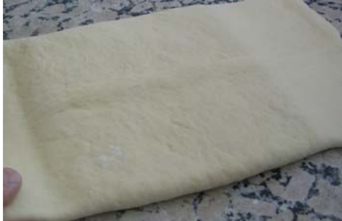
Enfermer la détrempe